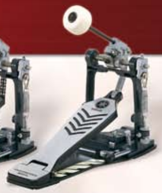
FP 9410 Pedal m/direct drive. Inkl. pose Pris: kr. 1.150,-