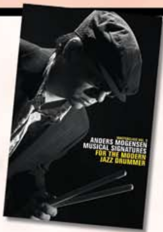
Anders Mogensen DVD Musical signatures Kun kr. 195,-