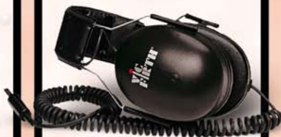
Vic Firth Headphones. Specialdesignet til trommer. Kun kr. 675,-