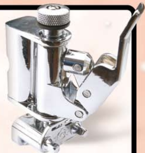
Dunnett seiding mekanisme Kun kr. 495,-