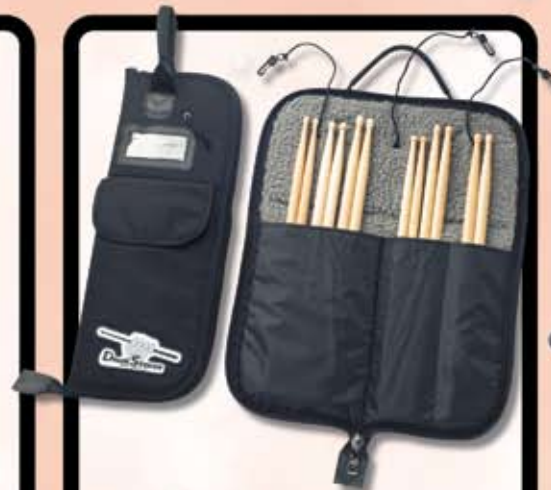
Humes & Berg stiktafse Drumseeker serien Kun kr. 195,-