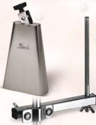
Pearl koklokke m/holder Før kr. 495,- Nu kr. 250,-