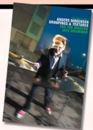
Anders Mogensen DVD Groupings & textures Kun kr. 195,-