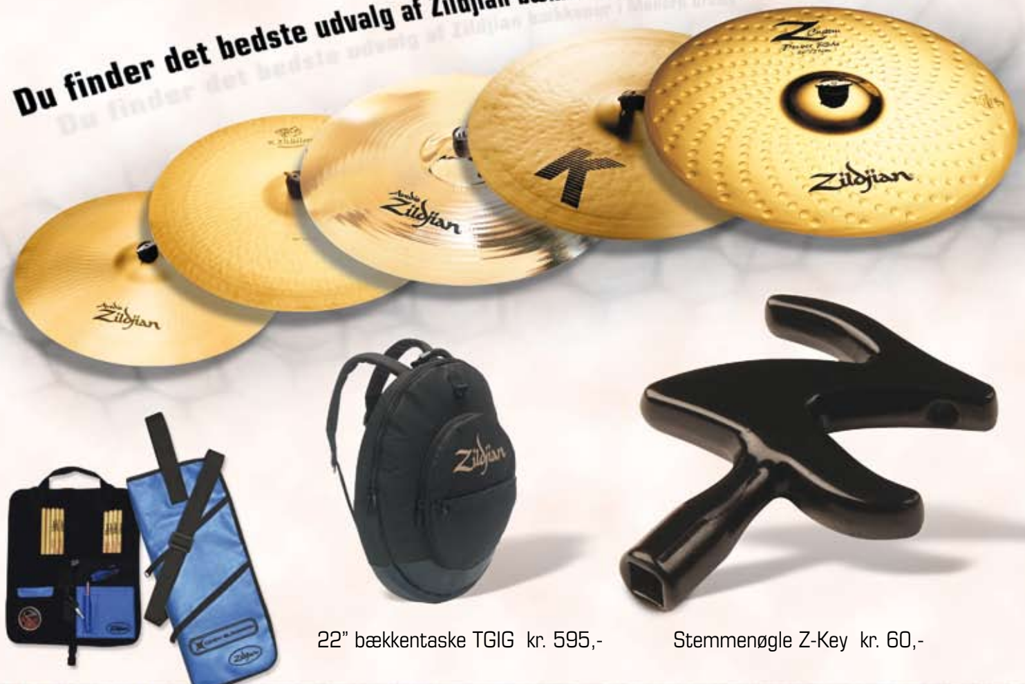
22" bækkentaske TGIG kr. 595,-

Du finder det bedste udvalg af Zildjian bækkener i Modern Drums