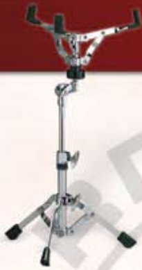
SS 652 Lillstrommestativ til 12" Pris: kr. 385,-