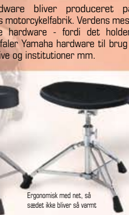
DS 840 Trommestol m/dobb.ben Pris: kr. 825,-

Ergonomisk med net, så sædet ikke bliver så varmt