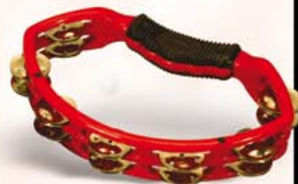
Natal Tamborin. Før kr. 295,- Nu kr. 195,-