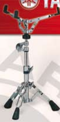
SS 840 Lillstrommest. m/dobb.ben Pris: kr. 580,-