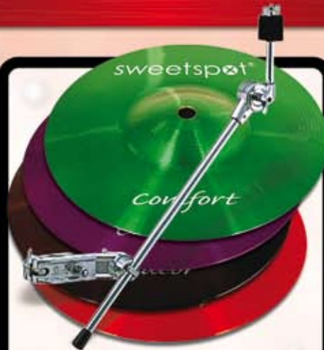
Sweetspot splash bækken m/Pearl CH 70 arm Før kr. 690,- Nu kr. 350,- Farver: Rød, grøn, sort, violet eller messing.