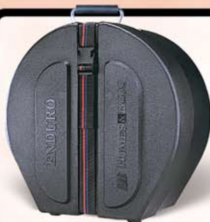
Humes & Berg lilletrommekasse Enduro serien Før kr. 795,- Nu kr. 495,-