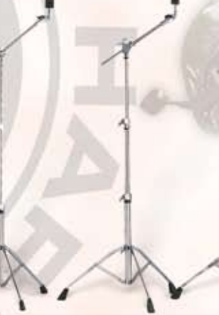
CS 655 Bækkenst. enkeltben Pris: kr. 385,-