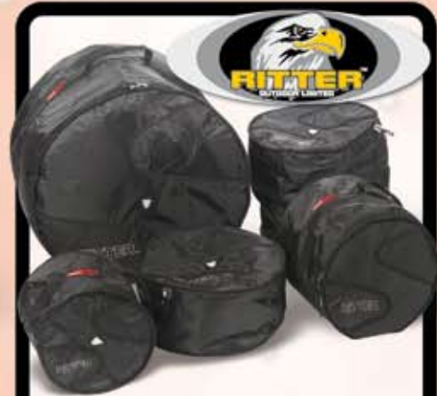
Ritter Trommebags økonomi sæt kr. 695,-