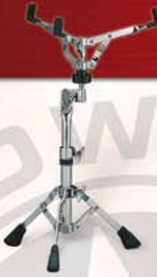
SS 740 Lillstrommest. m/enkeltben Pris: kr. 415,-