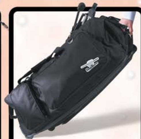
Humes & Berg stativtaske Drumseeker serien Før kr. 795,- Nu kr. 495,-