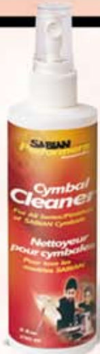
Sabian Cymbal rens Kun kr. 89,-