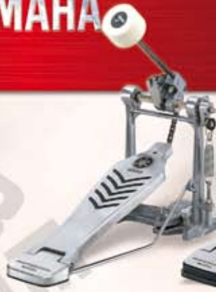
FP 7210 Robust pedal m/kædetræk Pris: kr. 575,-