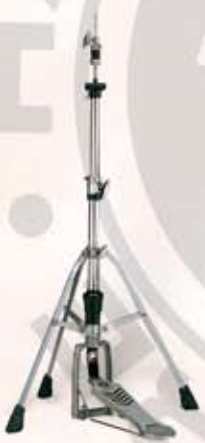
HS 740 Hi-hatstativ m/enkeltben Pris: kr. 795,-