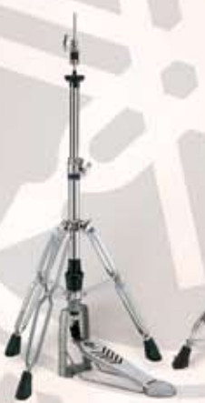
HS 840 Hi-hatstativ m/dobb.ben Pris: kr. 855,-