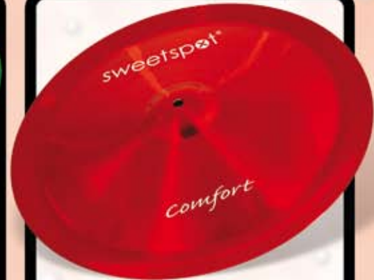
Sweetspot china bækken. Før kr. 795,- Nu kr. 295,- Farver: Rød, grøn, sort, violet eller messing.