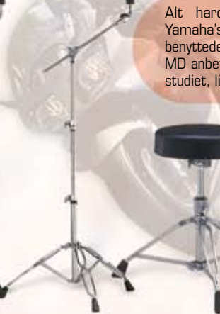
CS 745 Boomst. m/enkeltben Pris: kr. 640,-