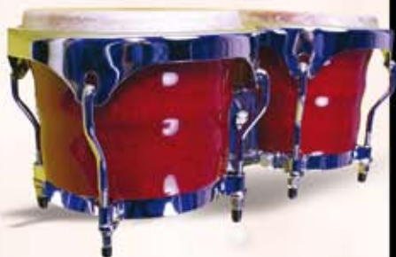
Natal Bongo sæt. Før kr. 1.295,- Nu kr. 695,-