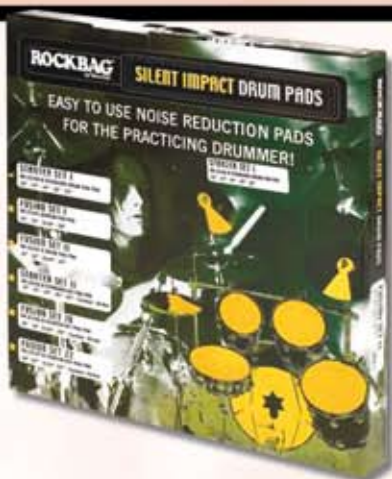
Rockbag dæmper sæt, komplet kr. 495,-