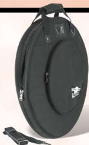
Humes & Berg bækkentaske Drumseeker serien Før kr. 895,- Nu kr. 595,-