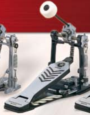
FP 9310 Pedal m/kædetræk. Inkl. pose Pris: kr. 1.150,-