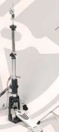
HS 1100 Hi-hatstativ m/2 ben Pris: kr. 1.395,-