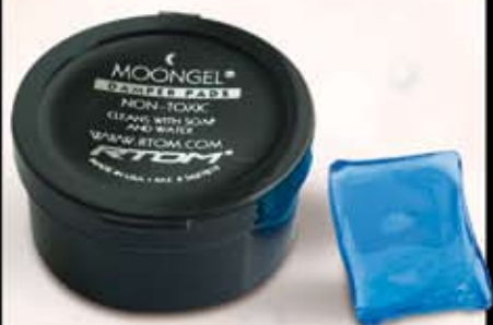
Moongel kr. 85,-