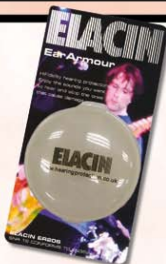
Ørepropper. Kun kr. 149,-